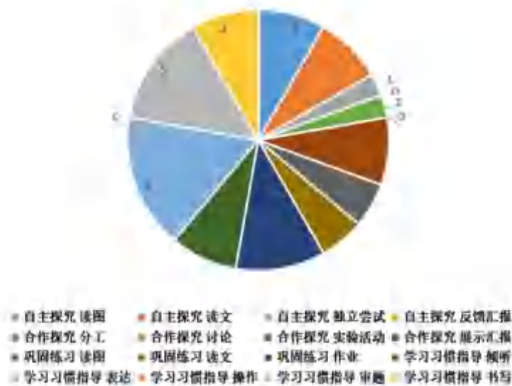
图3 指导行为记号体系观察量表数据统计示例

养了更多能说会道的孩子，有一定的示范作用。操作0次。审题指导5次，本课中老师关注学生，对于粗心不看题的孩子都有单独审题指导，在习题出现后，也会给予孩子指导和提醒，让孩子学会找关键信息，并用符号或者波浪线勾一勾，这样提醒以后，能够帮助孩子准确找出的答案，提高正确率。书写指导3次，强调连线法用直尺，规范连线，也提醒孩子错题要擦干净，保持书面整洁。